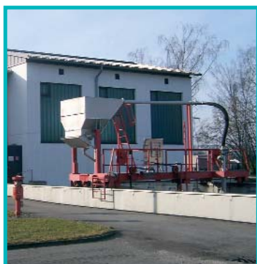
Rechengebäude und Sandfang