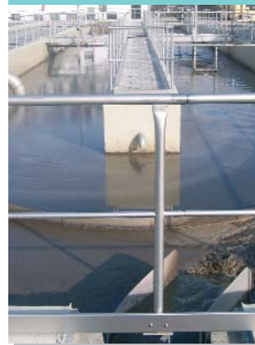
Zulauf Denibecken Biologie 1

Die ursprünglichen Belebungsbecken (4 x 1000 m 3 ) werden jetzt als vorgeschaltete Deni-Umlaufbecken (2 x 2.000 m 3 ) betrieben, zur Umwälzung wurden Rührwerke eingebaut. Der Trockensubstanzgehalt beträgt ca. 5 g/l. Das Schlammalter liegt bei 11 d.