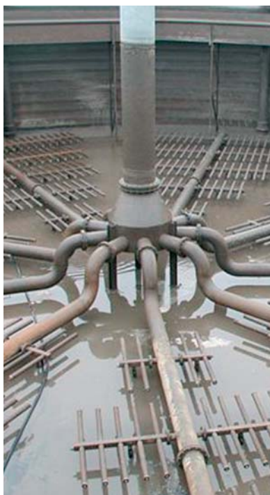
Ansicht des Nitrifikationsbeckens I der Biologie 2 in entleertem Zustand

Anfang der achtziger Jahre wurde eine mechanische Schlammwässerung (Siebbandpresse) nachgerüstet, der anfallende Klärschlamm wurde bis Mitte der neunziger Jahre größtenteils in die Landwirtschaft abgegeben.